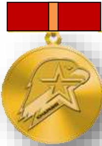
Золотой знак юнармейской доблести