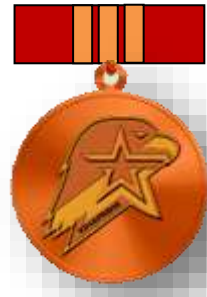
Бронзовый знак юнармейской доблести