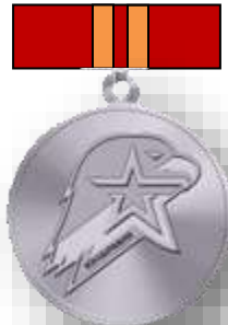
Серебряный знак Юнармейской доблести